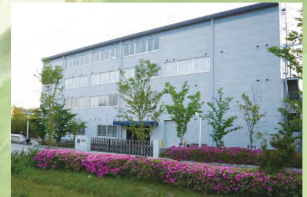
ならやまR&Dセンター Narayama R&D Center

Products ● Dryer Systems ● Crystallizer Systems ● PET Recycle Systems ● Solid State Polymerization Systems ● Research and Development