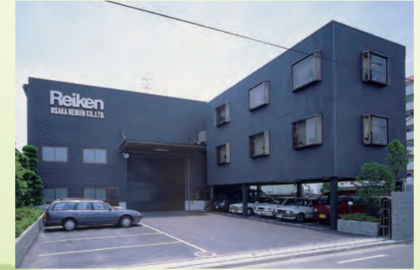
本社・吉田工場 Headquarter and Plant